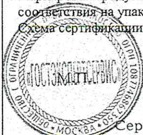
Схема сертификации 3.

Маркировка продукции знаком соответствия производится по ГОСТ Р 50460-92. Место нанесения знака соответствия на упаковке и в сопроводительной документации.