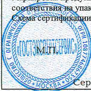
Схема сертификации 3.

Маркировка продукции знаком соответствия производится по ГОСТ Р 50460-92. Место нанесения знака соответствия на упаковке и в сопроводительной документации.